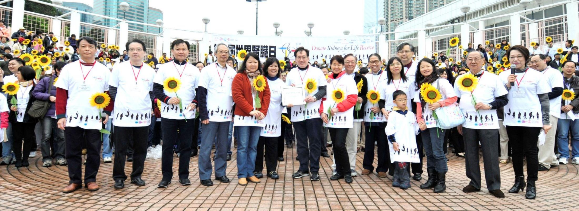
腎臟捐贈者、受贈者及嘉賓合照