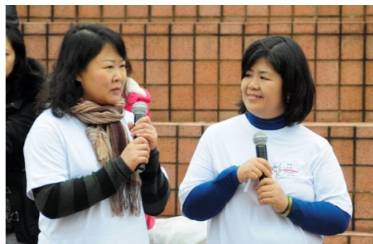
學護妹妹捐腎給姊姊（25年前）