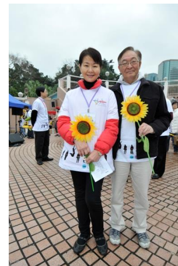
香港第一對成功由配偶捐腎的個案（25年前）