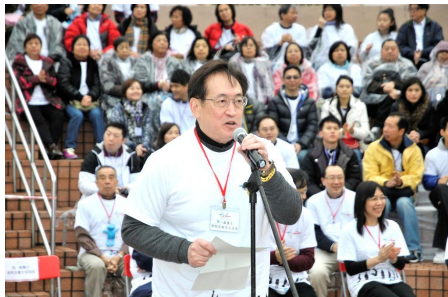
主禮嘉賓致辭 食物及衛生局局長周一嶽醫生