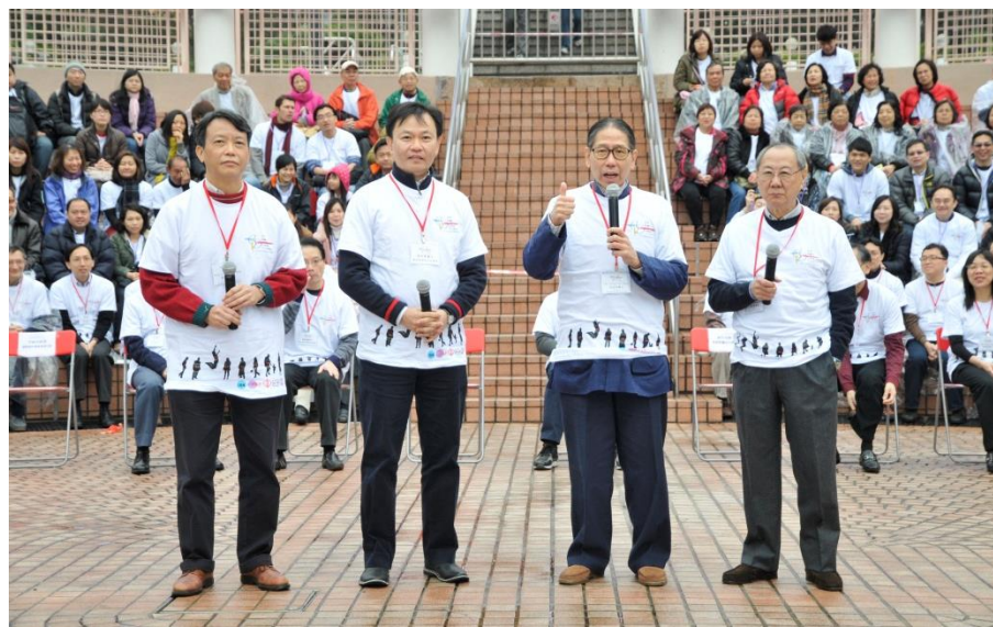
嘉賓致辭（從右至左） 香港腎臟基金會贊助人余宇康教授 香港腎臟基金會會長梁智鴻醫生 醫院管理局總裁梁栢賢醫生 國際腎科學會常委李錦滔教授