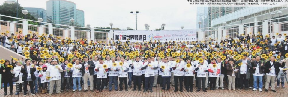
▲第七屆世界腎臟日在香港九龍公園廣場舉行，出席的醫護人員、香港腎科學會及家人、大眾及病友到場，與食物及衛生局局長一同發掘紀念鐘「千禧太陽」，為病人打氣。

有關「第七屆世界腎臟日在香港」之活動及「腎病自我評估」於二零一二年三月二十九日在本港八份報章全版刊登